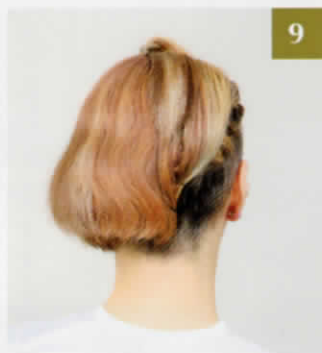
9 完成です。きものや気分によって、左右両方編み込むスタイルにアレンジしてもOK。