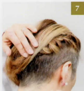
7 三つ編みの毛先を中に入れ込みピンで留め、編み込みに上の残りの髪を被せます。