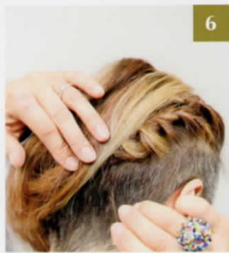
6 残りのサイドヘアも5同様にします。髪の量によって2本でもOKです。