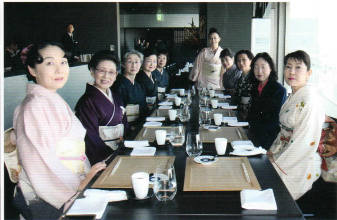
新春を寿ぐあめでやかなご一行は、東京スカイツリーツアー&お食事会です。レストランがパツと華やかな雰囲気になりました。