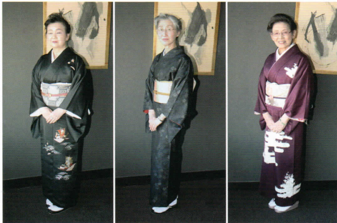
黒地に宝船のおめでたい装いながら、全体をシックにまとめあげました。