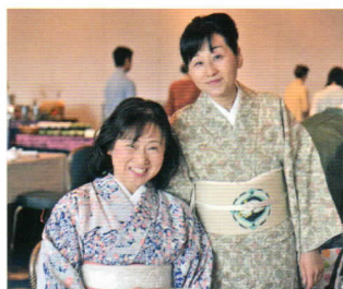
春らしい小紋で柔らかい笑顔のお二人。

右から A / 江戸小紋の斜め取りで全体をスッキリまとめた都会派の装いにセンスを感じます。 B / 柔らかい印象のカゴメの飛び柄の小紋は、女性らしい優しさを醸します。 C / 縁起の良い唐花唐草を絞り染めで表現したダイナミックな小紋がとてもよくお似合いです。 D / 白地の清楚な訪問着は、カラフルな紋りが華やかで若々しい印象です。 E / 辻が花の可憐な訪問着はドレスのように見る人を魅了してしまいました。